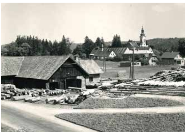
Das Sägewerk Kramer. Heute steht auf diesem Anwesen das Lagerhaus Gleinstätten.