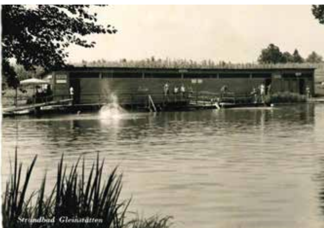
Das alte Strandbad am Badeteich von Gleinstätten – ein beliebter Treffpunkt für jung und alt.

Haben auch Sie alte Ansichten aus der Marktgemeinde Gleinstätten, die Sie gerne in einer der kommenden Ausgaben der Zeitung sehen wollen? Dann senden Sie diese bitte an redaktion@gleinstaetten.gv.at