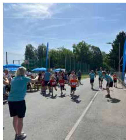
Bist du, so wie Traubi - das Familienmaskottchen der Südsteiermark - bereit für das coolste Event des Frühlings?

Wir freuen uns auf rege Teilnahme und auf ein tolles Rahmenprogramm rund um den Welschlauf, mit dem Startfest in St. Johann i.S. und dem Zielfest in Ehrenhausen.