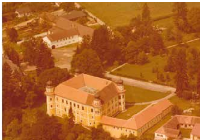
Eine Luftaufnahme vom Schloss Gleinstätten und der umliegenden Gegend - damals war rundherum noch weniger bebaut als heute.

Haben auch Sie alte Ansichten aus der Marktgemeinde Gleinstätten, die Sie gerne in einer der kommenden Ausgaben der Zeitung sehen wollen? Dann senden Sie diese bitte an redaktion@gleinstaetten.gv.at