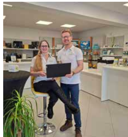
MaHe Solutions www.mahe.solutions Tel.: 0720 / 895042

Als Partnerbetrieb der Geräte-Retter-Prämie können Kundinnen und Kunden zusätzlich von Förderungen bei Reparaturen profitieren.