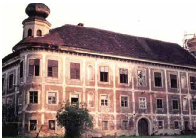
Das Schloss Gleinstätten vor der Sanierung im Jahre 1976. Heute ist hier, wie wir alle wissen, die Volksschule untergebracht.

In dieser Ausgabe haben wir den Blick auf den Ortsteil Gleinstätten gerichtet und passend dazu vier Bilder herausgesucht.